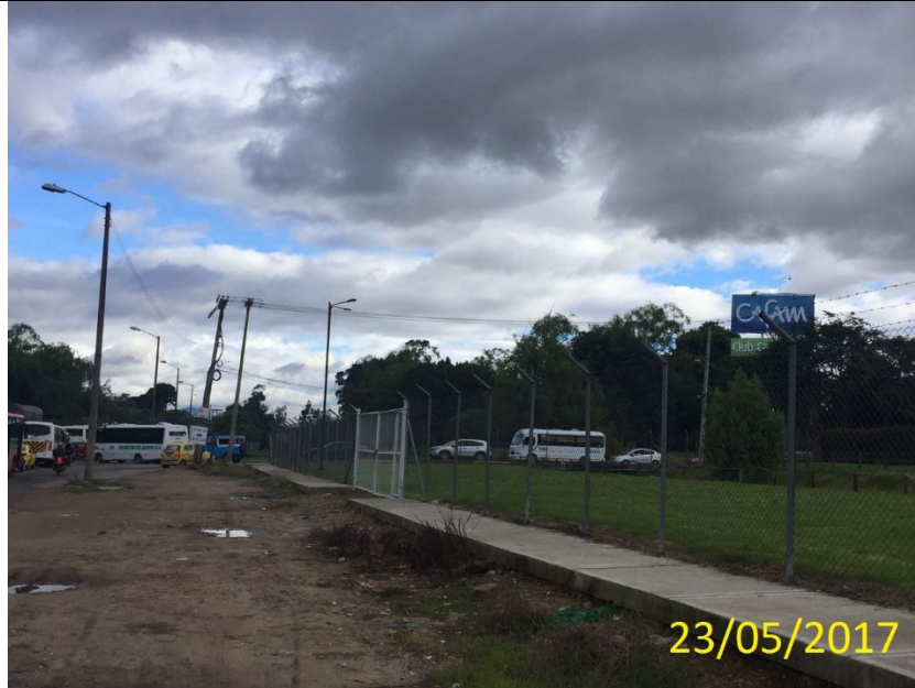
FOTOGRAFIA 3: Foto del predio ubicado en la Calle 215 No. 45 - 45, en el cual no se encuentra instalado el elemento de publicidad exterior visual tipo valla tubular.