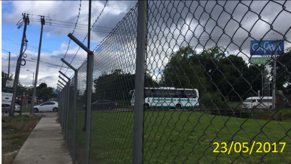
FOTOGRAFIA 1: Foto del predio ubicado en la Calle 215 No. 45 - 45, en el cual no se encuentra instalado el elemento de publicidad exterior visual tipo valla tubular.